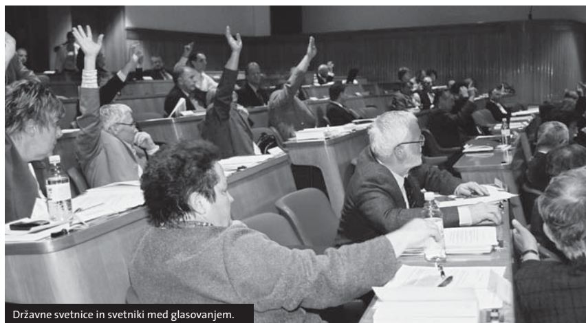
Državne svetnice in svetniki med glasovanjem.