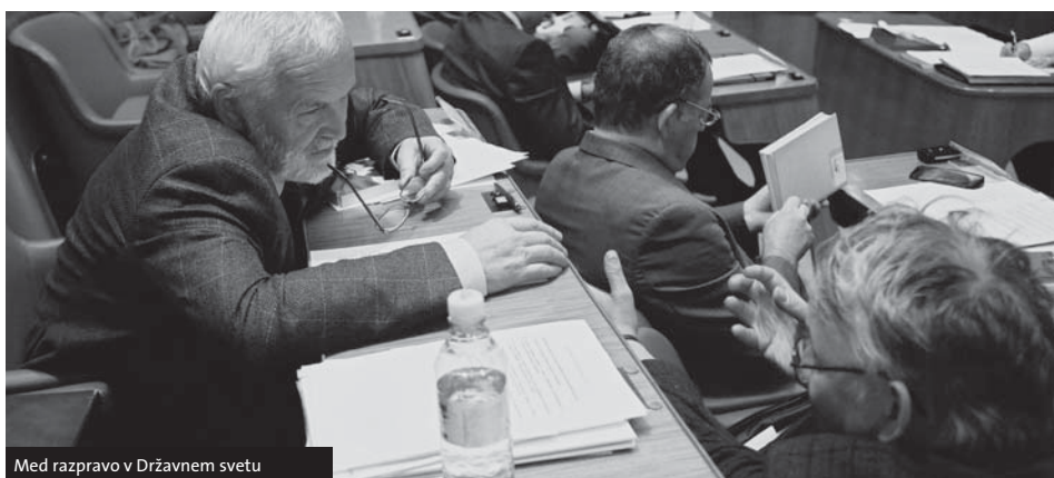
Med razpravo v Državnem svetu