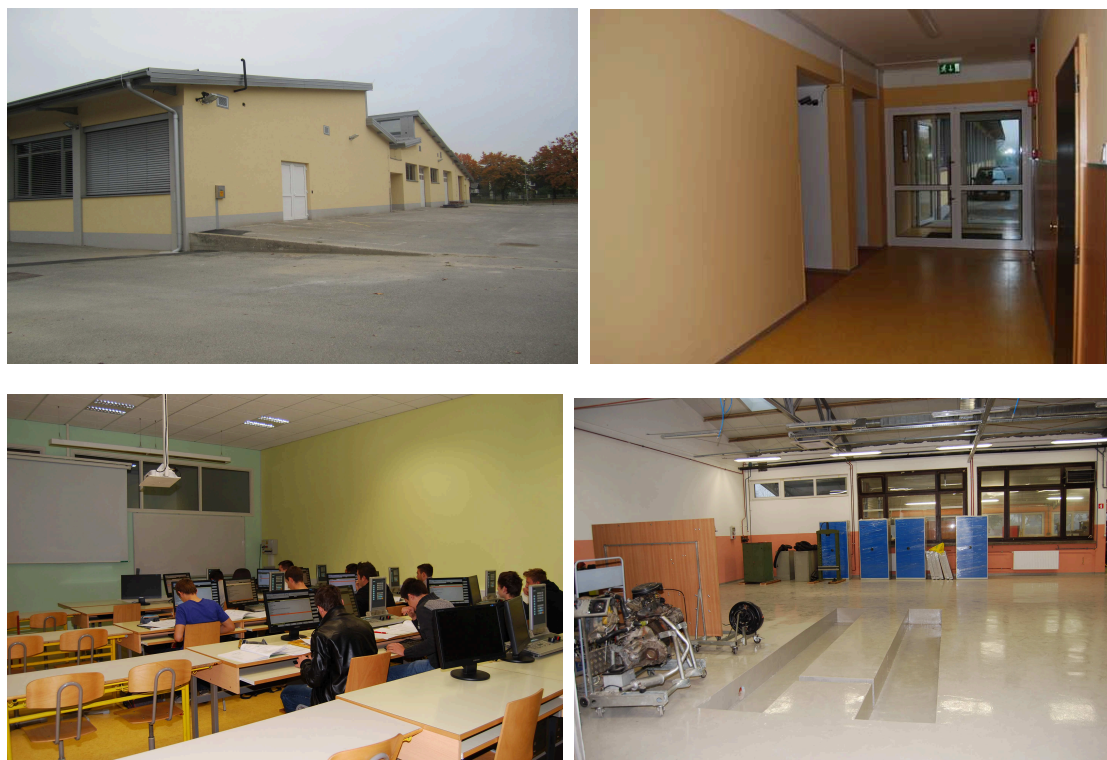
Slika 1: Prikaz ureditve MIC